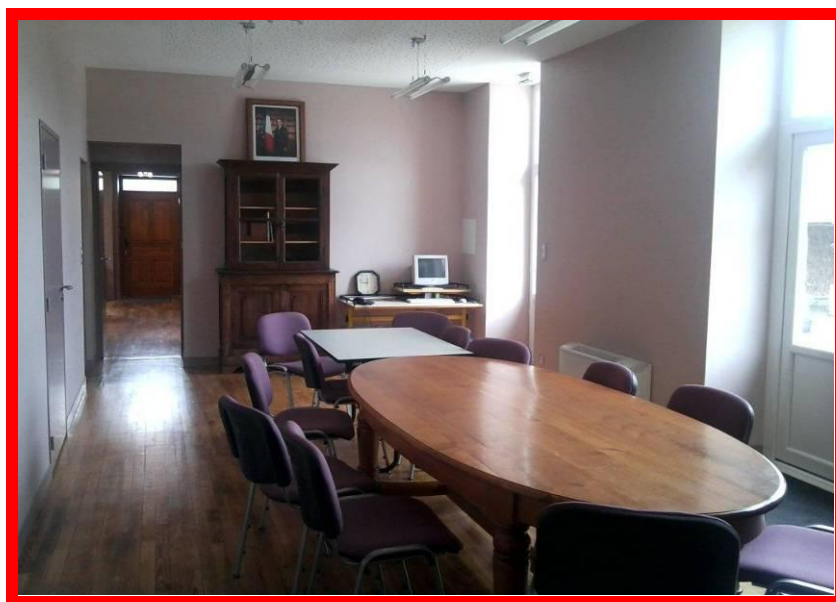
Salle de réunion du Conseil Municipal