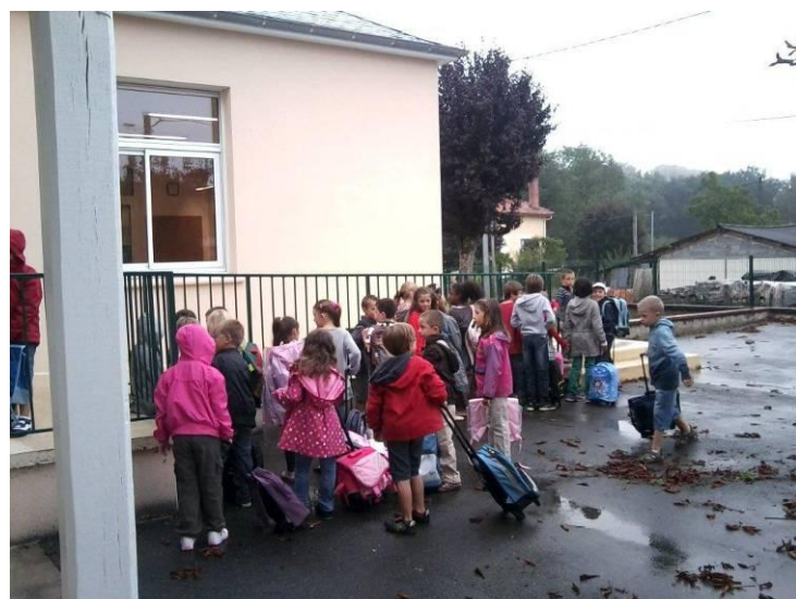
Rentrée scolaire 2011 à NONARDS

NONARDS → 25 LANTEUIL → 1 LIOURDRES → 1 PUY D'ARNAC → 12 TUDEILS → 12 BRIVEZAC → 1 LOSTANGES → 1 CUREMONTE → 1 BEAULIEU → 1 SIONIAC → 2