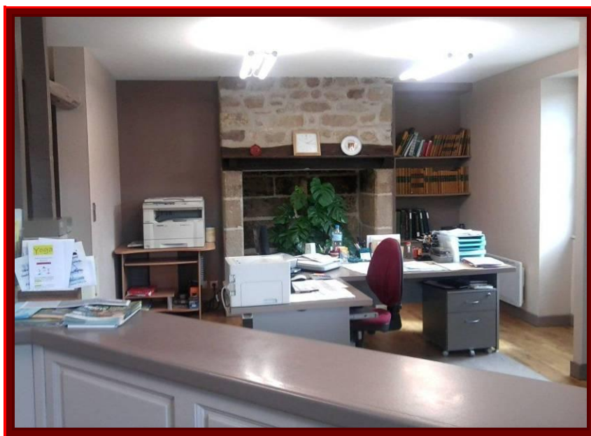
Salle d'accueil Mairie de NONARDS

Les 1er et 3ème mercredis de chaque mois de 14 à 16 heures