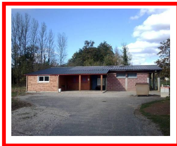
Le local du foot après agrandissement